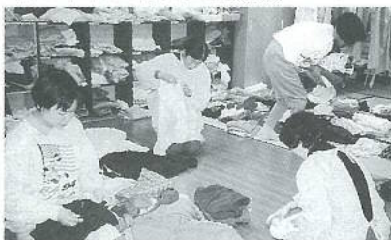
ボランティアの皆さんの活動風景

方は週に1回洗濯物たたみに来て下さい。皆さんは仕事を終えられた後夜7時半に集まってこられ50人分の洗濯物をたたんで分けて下さいます。苑ではこのように社協登録された方、J Aヘルパーの皆さん、又個人的にとりいろいろの形で、散髪や入