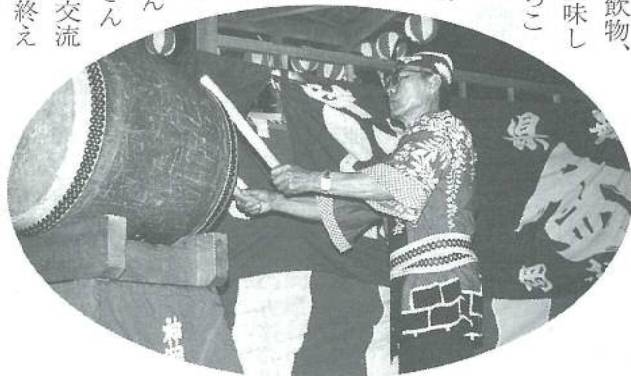
太鼓を打つ姿に思わずみとれてしまいます