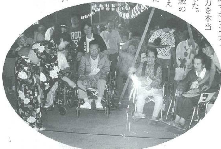
子供にかえり皆さん楽しそう

このように地域の皆さんの協力をえられる事は当苑にとって貴重な財産となり、地域に密着したたんぽぽ苑になれるよう今後も一層努力をしていかねばならないと感じました。