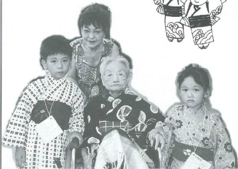
この日のために浴衣に着替え家族の人とハイポーズ

今年も恒例となった、たんぽぽ苑納涼祭を八月十七日に開催しました。今回で三回目となりこの日が来るのを楽しみにして見える入苑者の方も沢山