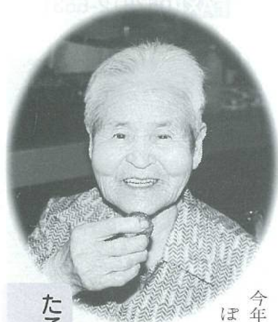
たこ焼きを手に 思わずニッコリ