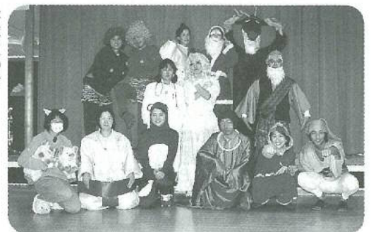
好評につき 今年も職員仮装で勢揃い!