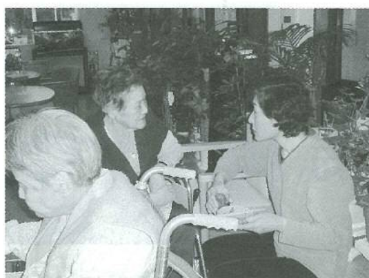
たんぽぽ会のみなさん 居酒屋お手伝い