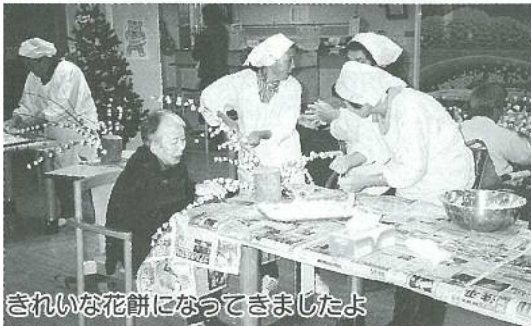
きれいな花餅になってきましたよ

年末最後のイベント行事 としてクリスマス・忘年会 を行いました。調理職員に よるハンドベルの演奏で始 まり、雰囲気盛り上げる ため全職員が仮装をしまし た。