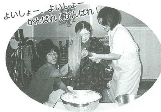
よいしょー、よいしょー がんばれ！がんばれ！