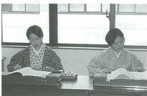
大正琴の音色がとてもきれい

普段見られない職員の着物は、とても古風でかわいらしく、見ているみなさんに好評でした。