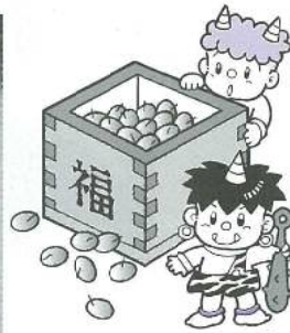
鬼はー外 福はー内 赤鬼めがけて、豆まき豆まき