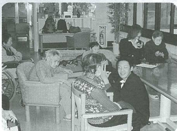
飛騨神岡高校 家庭クラブボランティア