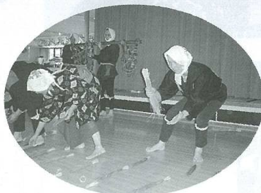
吉田五寿会 誕生会にて踊り等披露