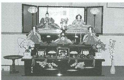
みなさんにとっても好評なおひな様