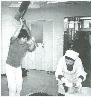
見よ！この男性職員の勇姿…。

紅白のお餅を取り分け、 入所者の方々に花餅を作っ て頂きました。 とてもきれいな花餅ができ あがり、できたばかりの花 餅を見ながら食べるおしる こはとっても美味しそうで した。