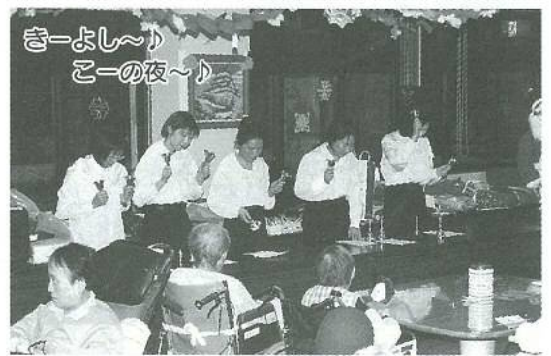
きーよし～♪ こーの夜～♪