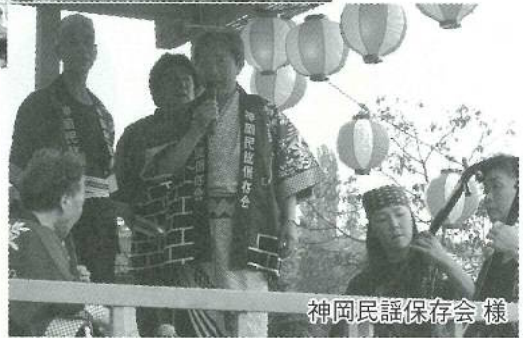
神岡民謡保存会様

今回もたくさんのボランティアの方々にご協力頂きました。 今回紹介させて頂いた以外にも、たくさんのボランティアの方々にご協力頂いております。 こういった善意なる活動によってたんぼぼ苑は支えられている事に感謝をし、皆様方のご支援に少しでもお応えできるように、これからも頑張りたいと思っておりますので今後とも宜しくお願い致します。