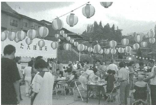
民謡に合わせて盆踊り

そんな中、昨年よりも多くの方々に足を運んで頂きました。地域の皆様や家族の方々、ボランティアの方々のご協力により納涼祭を行えました事を深く感謝申し上げます。本当に有り難うございました。