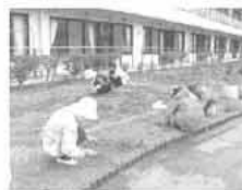
▲日赤奉仕団寺林分団様